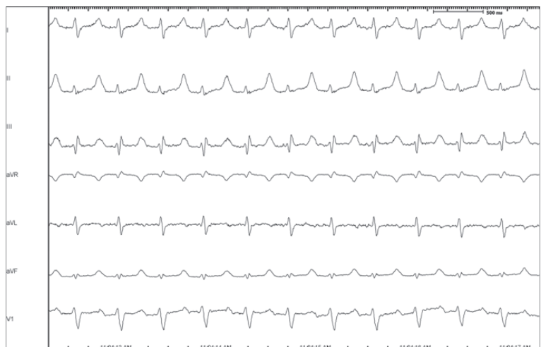
Рис. 1. Отведения поверхностной ЭКГ I, II, III, aVL, aVR, aVF, V1. При векторном анализе предсердного комплекса ЭКГ во время тахикардии выявлен положительный зубец P' в отведениях I, II, III, aVF и V1.

Учитывая неэффективность неоднократных интервенционных вмешательств, решено выполнить операцию изоляции левого предсердия в условиях «открытого» сердца. В условиях искусственного кровообращения, гипотермии и фармако-холодовой кардиopleгии нами была выполнена операция изоляции левого предсердия с применением криотермии. Доступ к сердцу осуществлялся через срединную стернотомию. По стандартной методике канюлированы аорта и отдельно полые вены, после чего начато гипотермическое искусственное кровообращение. После введения кардиopleгического раствора в корень аорты была выполнена правая атриотомия. Визуализация структур левого предсердия достигалась через межжавальный разрез крыши левого предсердия с частичным отсечением устьев правых легочных вен (рис. 3а). При ревизии левого предсердия и его ушка тромбов не обнаружено. Все последующие повреждения создавались с использованием криотермии: